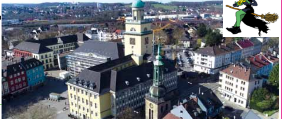
Beispiel Witten Innenstadt

* Nur im Rahmen der gesetzlichen Bestimmungen für die Verwendung von Drohnen.