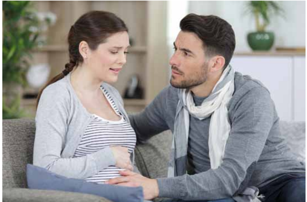
Angehörige sind oft die wichtigste Stütze für depressiv Erkrankte. Um die Krankheit zu verstehen und sich selbst nicht zu überfordern, bietet der AOK-Familiencoach Depression wertvolle Unterstützung.

Das neue Modul informiert über die Anzeichen der Erkrankung. Dies sind neben allgemeinen Depressionssymptomen auch fehlende Mutter- oder Vatergefühle, das Gefühl der Überforderung in der Elternrolle sowie Ängste, dem Kind zu schaden oder seine Bedürfnisse nicht erfüllen zu können. Diese Beschwerden unterscheiden sich