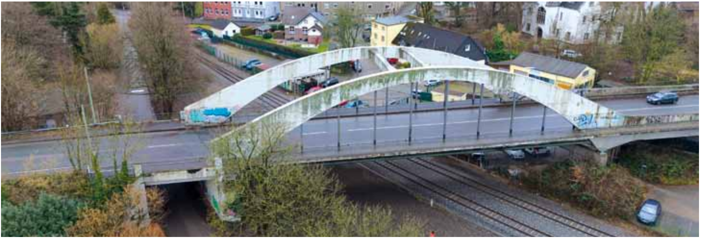
Die Omega-Brücke in Witten-Herbede , die über den Bahnhof der Ruhrtalbahn führt, ist baufällig. Die Sanierungspläne für die Herbeder Brücken sehen u. a. eine Vollsperrung dieser Brücke voraussichtlich im Jahr 2031 vor.